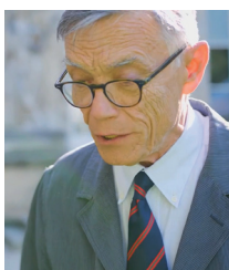
André de Montalembert