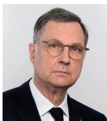
Gilles de Courcel