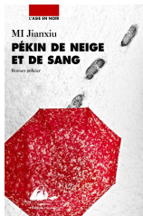
MI Jianxiu – Pékin de neige et de sang ((Ed Picquier Poche 04 /2020)

Point de vue sur Shanghai : Incurable snobisme, vacuité sans fonds. Ses habitants vénèrent l'argent, leurs valeurs sont ineptes, mentalité néocoloniale. On y est servile envers les puissants, mais d'une arrogance impitoyable à l'égard des petits et des faibles. Divers propos sur la Chine et réflexion de l'auteur sur ce qu'est devenu son pays. Le putsch du divertissement a sonné la mort des penseurs. La réflexion n'a plus droit de cité. Il faut faire un effort pour construire un monde qui ait du sens. C'est parce que ce questionnement fait défaut que les souffrances et les absurdités restent des objets de divertissement et de consommation.; La morale et le sens connaît une telle déroute que ces deux mots perdent toute signification ;