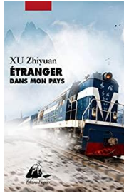
Xu Zhiyuan - Etranger dans mon pays (Ed. Philippe PICQUIER 07/11/2019°

Point de vue sur Shanghai : Incurable snobisme, vacuité sans fonds. Ses habitants vénèrent l'argent, leurs valeurs sont ineptes, mentalité néocoloniale. On y est servile envers les puissants, mais d'une arrogance impitoyable à l'égard des petits et des faibles. Divers propos sur la Chine et réflexion de l'auteur sur ce qu'est devenu son pays. Le putsch du divertissement a sonné la mort des penseurs. La réflexion n'a plus droit de cité. Il faut faire un effort pour construire un monde qui ait du sens. C'est parce que ce questionnement fait défaut que les souffrances et les absurdités restent des objets de divertissement et de consommation.; La morale et le sens connaît une telle déroute que ces deux mots perdent toute signification ;